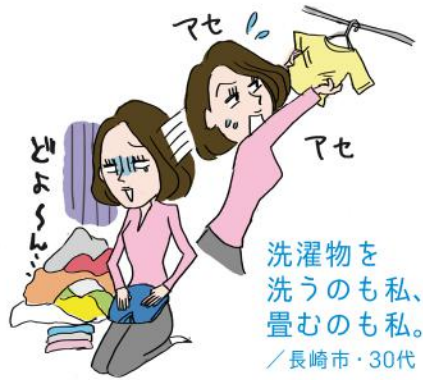
洗濯物を洗うのも私、 畳むのも私。 ／長崎市・30代