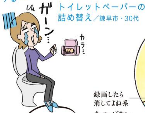
トイレtpーパーの詰め替え ／諫早市・30代