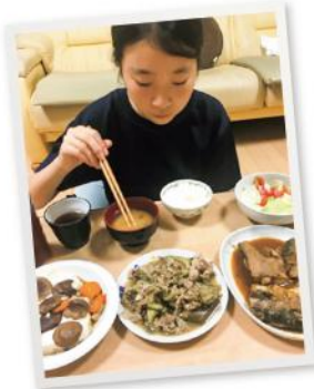
志朗さんお手製晩御飯