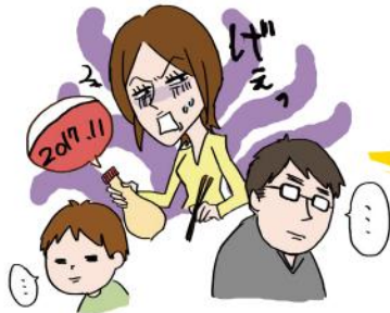
賞味期限切れの物を、 皆、見て見ぬふりをする… ／大村市・30代