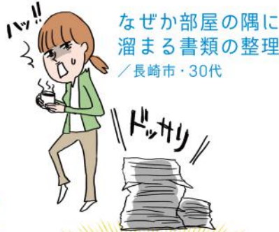
なぜか部屋の隅に溜まる書類の整理 ／長崎市・30代